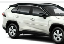
Owiewki szyb bocznych Nadwozie

Toyota RAV4 2.0 Benzyna JTMW43FVX0D129388